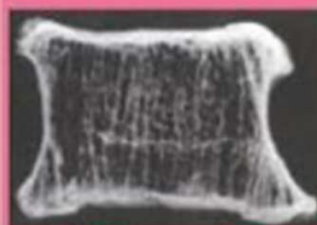
骨塩量の低い状態